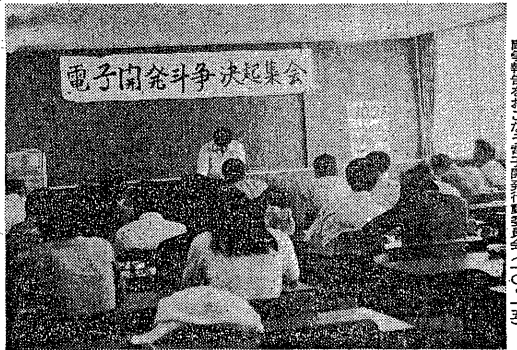
電子開発闘争決起集会(10・15)

田中政権の準備は、内外ともに極めて深刻な状況にある。田中政権の準備は、内外ともに極めて深刻な状況にある。田中政権の準備は、内外ともに極めて深刻な状況にある。