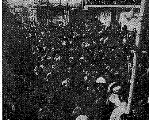
羽田闘争の激しさを示す、鉄より固い実力阻止の決意

【本紙記者東京九日電】羽田闘争は、今日、数時間の死闘を経て、ついに、羽田空港の閉鎖が完了した。この間、羽田空港には、約二千人の労働者が、鉄より固い実力阻止の決意をこめて、暴力的な闘争を展開した。この結果、羽田空港は、今日、完全に閉鎖された。