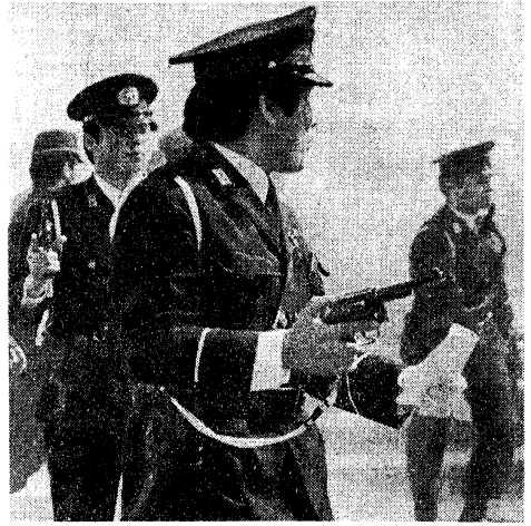
ピストルを乱射する警官