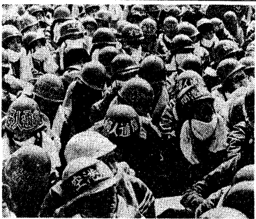
婦人行動隊につづけ!