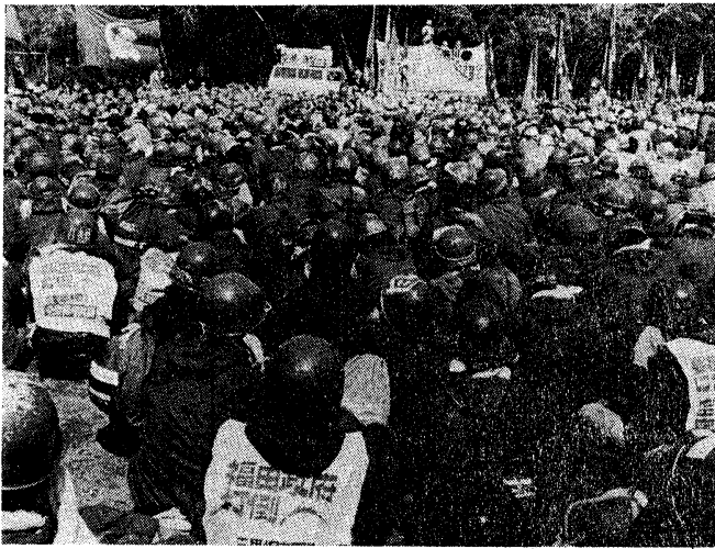
旗を持ち麦田小学校に結集