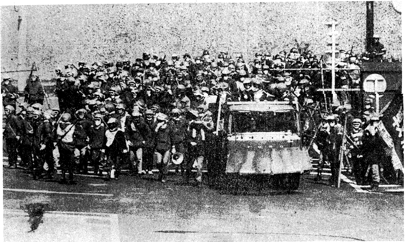
第八ゲートを突破し管制塔へ進撃！