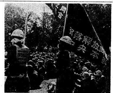
「ともに闘おう」と部解放同盟

午後一時、三浦市立第一公園で総決起集会が開かれ、約三千七百余人が参加した。この中で、決戦突入への決意は固まった。いざ! 空港へ実力進撃だ。 集会は、三浦市立第一公園で開かれ、約三千七百余人が参加した。この中で、決戦突入への決意は固まった。いざ! 空港へ実力進撃だ。