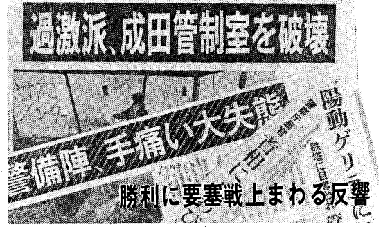
陽動ゲリニ響 勝利に要塞戦上まわる反響

過激派 成田管制室を破壊 陽動ゲリニ響 勝利に要塞戦上まわる反響 【東京3日電】成田飛行場管制室を破壊した過激派ゲリラ隊は、同日午後、成田飛行場を襲撃した。管制室は約10分間、機能不全に陥った。襲撃隊は約100名と推定され、管制室を破壊した後、飛行場を離れ、周辺地域に潜伏した。この襲撃は、ゲリラ隊の活動が激化していることを示している。また、ゲリラ隊は、成田飛行場の周辺地域に拠点を設け、活動している。この襲撃は、ゲリラ隊の活動が激化していることを示している。 【東京3日電】成田飛行場を襲撃した過激派ゲリラ隊は、同日午後、成田飛行場を襲撃した。管制室は約10分間、機能不全に陥った。襲撃隊は約100名と推定され、管制室を破壊した後、飛行場を離れ、周辺地域に潜伏した。この襲撃は、ゲリラ隊の活動が激化していることを示している。