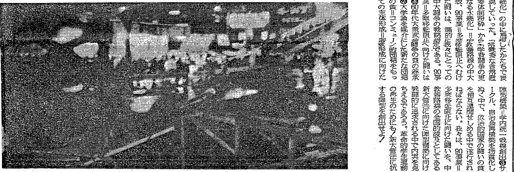
学生運動の激化を背景とした学生たちの怒りの原因と、その社会的背景を明らかにしようとするものである。

本報創刊90周年を記念して、さまざまな事業が計画されている。これは、読者の皆様への感謝の意を表し、本報の発展と社会貢献を期すためである。 具体的には、記念特刊の発行、読者プレゼントの実施、記者会見の開催などが予定されている。また、読者の皆様からのご意見やご要望も積極的に受け取り、本報の質を向上させていく方針である。 この90周年事業を通じて、読者の皆様とより密接な関係を築き、本報の発展と社会貢献を期す。読者の皆様のご支持とご協力をお願いいたします。