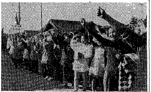
白山町母の会デモ (11・22)