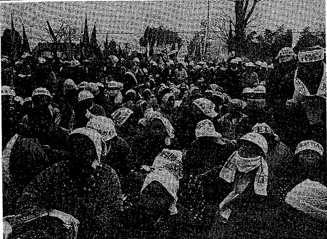
12・6集会 三里塚第2公園に結集

編集人 日本マルクス・レーニン主義者同盟 発行所 レボリューション社 東京千代田区錦町2-14 (電話03-56208) 東京 03-56208 大阪 06-771-8479 関西支社 大阪府大阪市東淀川区11-1 電話 大阪42691 九州支社 福岡県福岡市東区1-1 電話 福岡14475 東北支社 仙台市青葉区2-1-35 電話 0222 (25) 1294