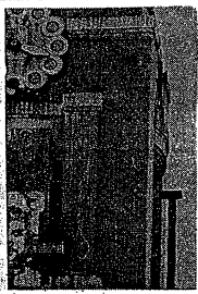
新地平切り拓いた実力闘争