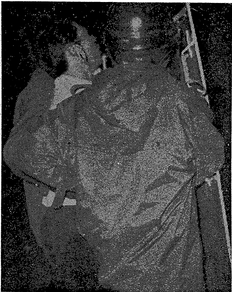
武装で機動隊の弾圧に抗議して闘っていた学友を警棒で乱打、頭から 学友逮捕 血を流して逮捕された。