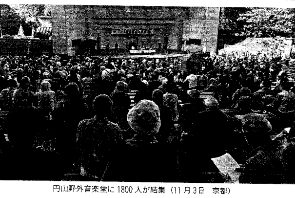
田山野山音堂に1800人が結集 (11月3日 京都)

冬期一時金のカンパを呼びかけます。 冬期一時金のカンパを呼びかけます。 冬期一時金のカンパを呼びかけます。