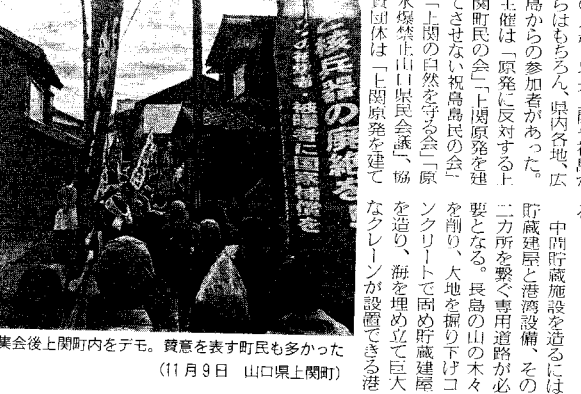
「いのちの海を守れ！ 上関町に原発も中間貯蔵施設もいらない！ 11・9反原発デー県民集会」に参加して（11月9日 山口県上関町）」