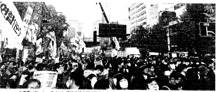
全委委 (ジョン・テイル) 精神継承全国労働者大会 (11月9日 韓国・ソウル: 報告記事2面掲載)

つづまり、共和党トランプの票が増えるよりも、民主党への投票が相対的に落ち込んでいるのだ。二〇二〇年にトランプ政権を批判し、民主党に期待した人たちの少なからぬ人たちが、二〇二四年の選挙では投票に行かなかったのだ。