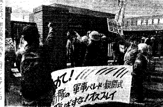
朝霞基地前で抗議申し入れ行動に取り組む(11月9日 埼玉県朝霞市)

一月九日、埼玉県朝霞市において自衛隊の中央観閲式が強行された。われわれはアジア共同行動(AWC)・首都圏の仲間とともに地元住民を主体とした反対行動に参加した。 中央観閲式は陸海空自衛隊の持ち回り主催で毎年開催される。今年は三年ぶり、朝霞基地での開催となった。観閲式は自衛隊の士気を鼓舞するものであり、首相が訓示をする。これはアジア人民に連帯し、改憲と戦争を止める立場から抗議行動に介入した。