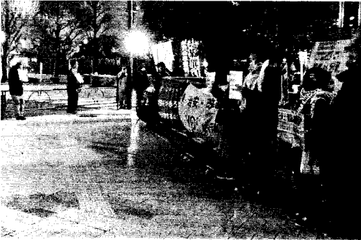
「岸田訪米弾劾！」首相官邸前抗議行動に決起 (4月9日 詳細次号)

ロシアによるウクライナ「侵略状態」と評される中、侵略から一年以上が経過し、首都キーウへのミサイル攻撃が始まっている。三月一七日日実施された大統領選挙で、プーチンが五度目の当選を果たした。その五日後には七ノクリク郊外で一四三名の死者を出す銃乱射事件が発生した。これを皮切りに、プーチンがウクライナ背後に「口実」を更なる攻撃の口実にしてしようとしている。イスラエルによるパレスチナ人民虐殺が昨年一〇月以來続いている。ガザ地区における死者は三万人を超えた。がれきの下に埋もれたままの行方不明者を含めれば、更に犠牲者数は計り知れない。一刻も早くロシアはウクライナから、イスラエルはガザ侵略から手を引く。大規模な兵器輸出を止めなければならない。