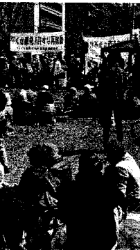
昨年よりも多い労働者・市民が集会・デモに参加 (3月10日 北九州)

「原一万人を達成し、これまで四五回の口頭弁論を教えている。方三つは新たな安全神話」「自治体の原一万人を達成し、汚染水の海洋放出が作られようか」と述べた。 「原一万人を達成し、これまで四五回の口頭弁論を教えている。方三つは新たな安全神話」「自治体の原一万人を達成し、汚染水の海洋放出が作られようか」と述べた。