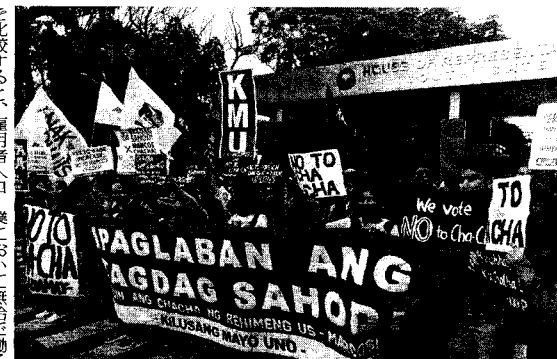
KMU (五月一日運動) の憲法改悪反対集会 (3月13日 フィリピン)

を比較すると、雇用者人口は四六九〇万人から四八二〇万人へ一三〇万人増えた。他方、失業者は二七〇万人から三〇二万人へ三二万人増えた。非正規職労働者もまた六八〇万人から五九〇万人へ九〇万人減った。