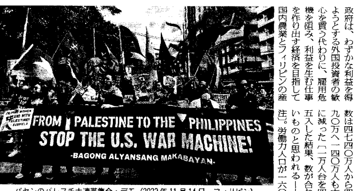
パヤンのパレスチナ連帯集会・デモ (2023年11月14日 フィリピン)

研究団体のイボン財団によれば、最新の労働力資料を踏まえて、イボンは雇用者数が減っている。これは、働く意欲を持つ人の減少という現象、および、労働力に含まれない人の数の増加に落ち込んだフィリピン労働者の数が増加していることを指す。フィリピン政府は、わずかな利益を得ようとする外国投資者の心を買って代わり、雇用危機を阻止、利益を生む仕事を作り出す経済を目指して国内農業とフィリピンの産