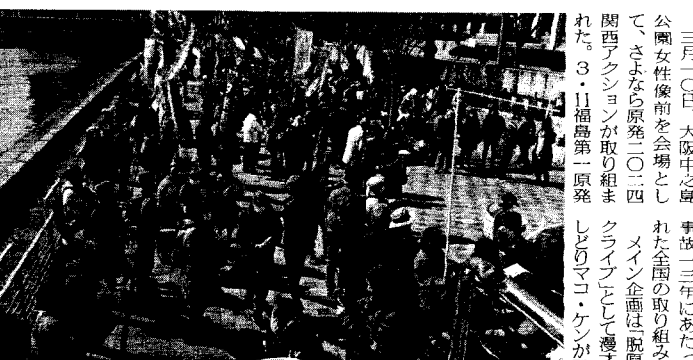
集会終了後、大阪キタの繁華街をデモ行進 (3月10日 大阪)