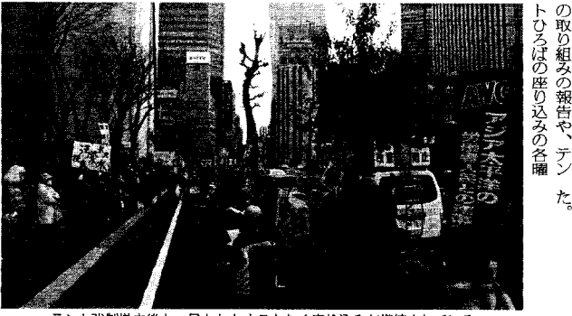
デント強制撤去後も一日も欠かすことなく座り込みが継続されている (3月11日 経産省前)

福島原発事故から三周年となる三月一日午後、脱原発・経産省前デントひろば呼びかけの脱原発・経産省前大集会に二〇〇名が参加した。