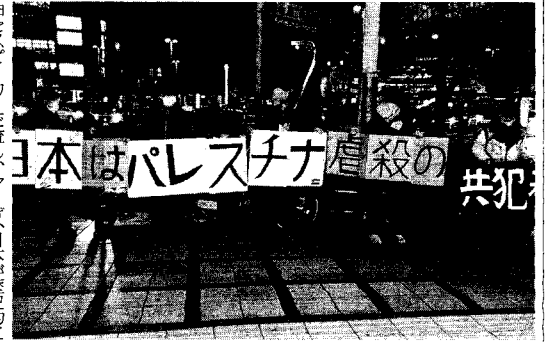
京都駅前前でプラカードを掲げスタンディング (1月30日 京都)

去る1月30日、AWC 「三原則」呼びかけの日本もパ レスチナ虐殺の共犯者だ！ スタンディング」が京都駅 前で行われた。パレスチナ 支援のためにつられた案