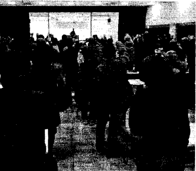
参加者全体の拍手をもって支援する会は結成された (1月25日 東京)

オプティカルハイテック 労組は韓国国内での争議を 続けるとともに、昨年一〇 月に第一次(大阪本社)、一 二月には第二次(東京本社) の屋上へ高空籠城に突入り した二名の組合員の様子映 り出される。緊迫した状況 のなかで、労働者としての