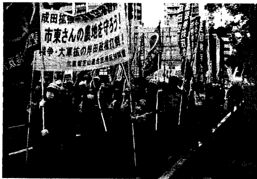
耕作権裁判への注目と支援を訴え千葉市内をデモ (1月22日 千葉)