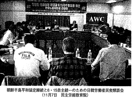
朝鮮半島平和協定締結と6・15自主統一のための日韓労働者民衆懇談会(11月7日 民主労総教育院)

厚木基地再編問題に関する発言が行われ、デモ行進が行われた。集会では、厚木基地の撤去を求め、基地の再編を見直しを求めた。集会では、厚木基地の撤去を求め、基地の再編を見直しを求めた。集会では、厚木基地の撤去を求め、基地の再編を見直しを求めた。