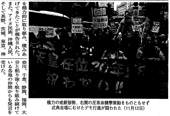
集会の最後には「平成天皇 20年奉祝に反対する国際声」...