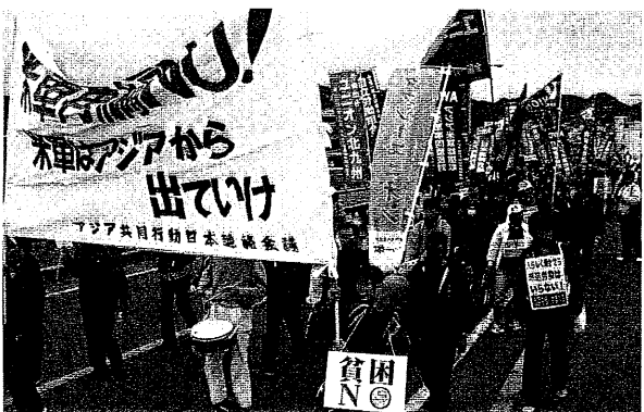
岩国基地に向けてデモ行進(山口・岩国市 11月29日:詳報次号)