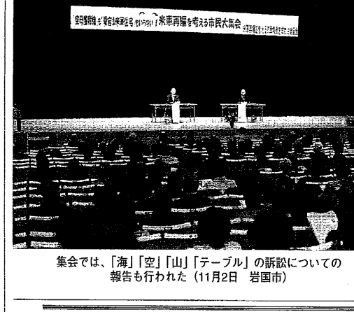
集会では、「海」「空」「山」「テーブル」の訴訟についての報告も行われた (11月2日 岩国市)