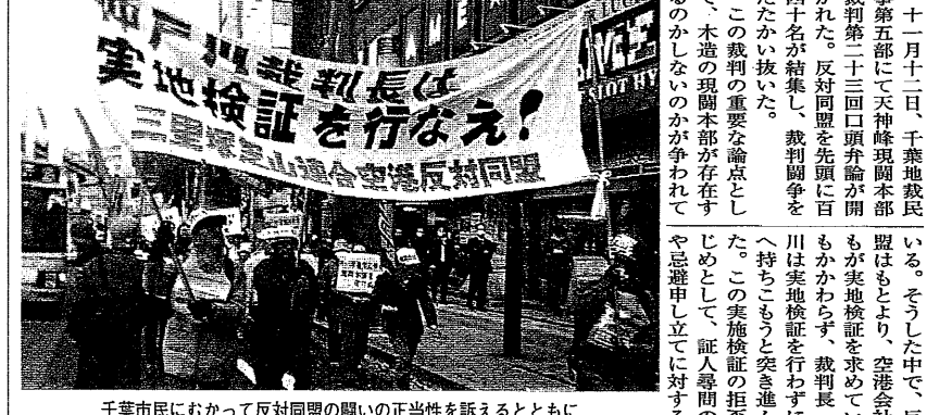
千葉市民にむかって反対同盟の闘いの正当性を訴えるとともに、裁判長仲戸川の不当な訴訟指揮を徹底弾劾(11月12日 千葉市)

十一月十二日、千葉地裁民衆訴訟第五部にて天神峰現闘本部裁判第二十三回公判が開かれた。反対同盟を先頭に百四十名が結集し、裁判官仲戸川は実地検証を行わずに結審したと批判した。この実地検証の拒否をめぐり、本誌の現闘本部が存在するのかが争われてきた。十一月十二日、千葉地裁民衆訴訟第五部にて天神峰現闘本部裁判第二十三回公判が開かれた。反対同盟を先頭に百四十名が結集し、裁判官仲戸川は実地検証を行わずに結審したと批判した。この実地検証の拒否をめぐり、本誌の現闘本部が存在するのかが争われてきた。