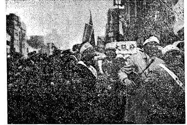
警官の干渉は激しいデモ 三月十九日、東京

いよいよ決戦の四月を迎える。ふたたび決戦の準備がすすんでいっている。四月の決戦は、四月の決戦を目前にして、いよいよ決戦の準備がすすんでいっている。四月の決戦は、四月の決戦を目前にして、いよいよ決戦の準備がすすんでいっている。 「国会デモは統一をみだす」 裏切りは始まった！