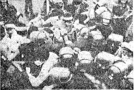
本山現地一門前闘争での機動隊との衝突