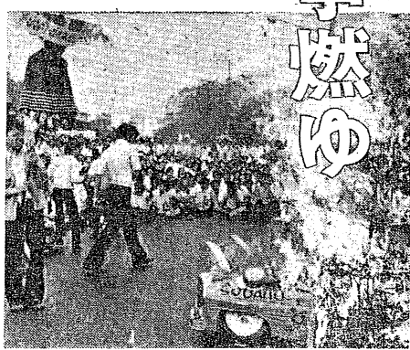
羽田闘争に決起した学生たち。背景には田中首相の訪亜阻止を叫ぶプラカードが掲げられている。