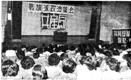
650名の労働者・学生は、7、7猛省精神で狭山決戦勝利を意志統一（7月7日）