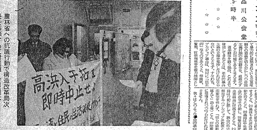
農林省への抗議行動で構造改革周次長を弾圧する反対同盟・支援団体

②高浜入干拓構想と日帝のごす黒い野望 高浜入干拓構想は、日帝の野望によるものである。日帝は、高浜入川沿いの土地を占領し、農地を開拓して、自国の利益を追求しようとしている。日帝の野望は、住民の生活を脅かすものである。干拓を阻止せよ!