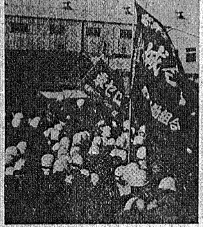
昨年12・17北門パレードを實力突破し構内集会がちな本山闘争

地域住民闘争、農民闘争と結合した七四春闘へ。労働者は、単なる賃上げを求めず、労働条件の改善と、社会の公正な発展を求めて奮闘している。 地域住民闘争、農民闘争と結合した七四春闘へ。労働者は、単なる賃上げを求めず、労働条件の改善と、社会の公正な発展を求めて奮闘している。