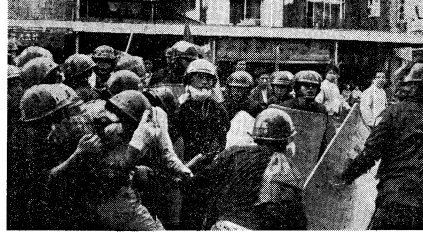
反米運動隊の旗を交する若へル部隊

米軍の横須賀基地は、日米共同軍事行動の強化と対決し、9.15横須賀現地闘争に決起した。この闘争は、日米共同軍事行動の強化と対決し、9.15横須賀現地闘争に決起した。この闘争は、日米共同軍事行動の強化と対決し、9.15横須賀現地闘争に決起した。