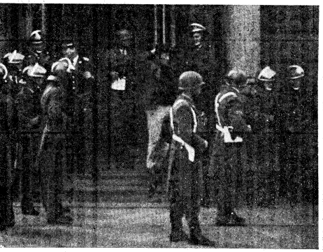
議事堂下院入口を武装制圧したチリ軍隊

我々のめざすべき労働者国家の方向。この方向は、プロレタリア革命の原則を堅持し、人民連合党を打ち立て、社会主義の陥穽を避け、我々のめざすべき労働者国家の方向を明確にする必要がある。アジエンデの失敗は、単なる戦術的ミスではなく、革命的左翼の道にあり、それは、プロレタリア革命の原則を堅持し、人民連合党と政府綱領を打ち立て、社会主義の陥穽を避け、我々のめざすべき労働者国家の方向を明確にする必要がある。