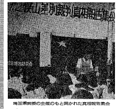
埼玉県発表の主張のもと開かれた真相報告集会

【東京5日電】日本共産党は4日、狭山刑務所での現調(現地調査)の成果を踏まえ、9月9日(日)に11月再開公判に勝利するまで闘争を継続すると発表した。 狭山刑務所では、9月5日(金)に再開公判が行われ、被告の弁護団は、判決に異議を申し立てた。 人民大集会は、5月5日(日)午後2時から、赤坂区赤坂2-2-1の東京地裁で開かれ、両被告の弁護団は、判決に異議を申し立てた。 判決は、両被告が暴徒の先鋒として暴行を加えたとして、それぞれ懲役5年6箇月と懲役5年4箇月の有罪判決を言い渡した。