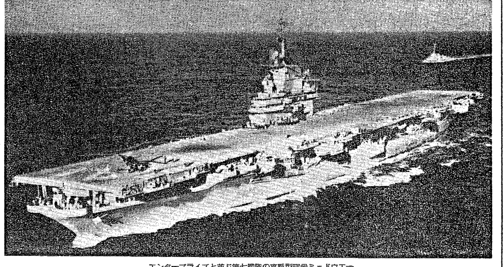
エンタープライズと並ぶ第七艦隊の最新型空母ミッドウェー

米海軍第七艦隊の最新型空母ミッドウェーは、横須賀に母港化する。この空母は、ミッドウェー島の戦いで沈没した空母の復讐艦として、1945年12月に建造された。長官は、この空母の母港化が、米海軍の太平洋戦略に重要な役割を果たすことを期待している。