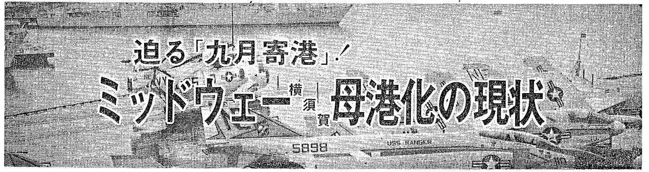
5898 USS RANGER

米海軍第七艦隊の最新型空母ミッドウェーは、横須賀に母港化する。この空母は、ミッドウェー島の戦いで沈没した空母の復讐艦として、1945年12月に建造された。長官は、この空母の母港化が、米海軍の太平洋戦略に重要な役割を果たすことを期待している。