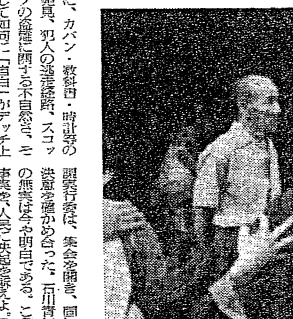
石川さん御前講と連帯を築く現調団

【東京5日電】日本共産党は4日、狭山刑務所での現調(現地調査)の成果を踏まえ、9月9日(日)に11月再開公判に勝利するまで闘争を継続すると発表した。 狭山刑務所では、9月5日(金)に再開公判が行われ、被告の弁護団は、判決に異議を申し立てた。 人民大集会は、5月5日(日)午後2時から、赤坂区赤坂2-2-1の東京地裁で開かれ、両被告の弁護団は、判決に異議を申し立てた。 判決は、両被告が暴徒の先鋒として暴行を加えたとして、それぞれ懲役5年6箇月と懲役5年4箇月の有罪判決を言い渡した。