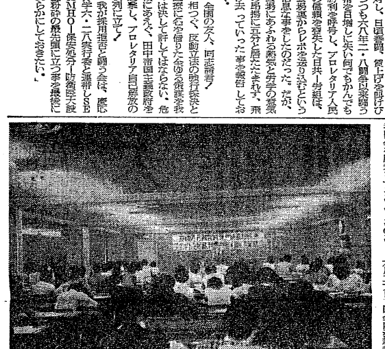
東京区民センターで総法連法連会をまとめる

【本報東京五日電】慶応義塾大学労働者会主催の「SEAHO 保安処分等 侵略反革命に一大反撃」の大集会が、六月二十八日午後八時、同大体育館で開かれ、約八千二百人が参加した。 【本報東京五日電】慶応義塾大学労働者会主催の「SEAHO 保安処分等 侵略反革命に一大反撃」の大集会が、六月二十八日午後八時、同大体育館で開かれ、約八千二百人が参加した。