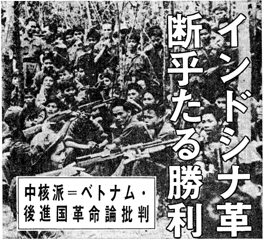
中核派=ベトナム・後進国革命論批判

インドシナ革命戦争の断乎たる勝利のために、我々は、中核派の革命論を批判する。中核派の革命論は、インドシナ革命戦争の断乎たる勝利を、中核派の革命論によって達成する。中核派の革命論は、インドシナ革命戦争の断乎たる勝利を、中核派の革命論によって達成する。