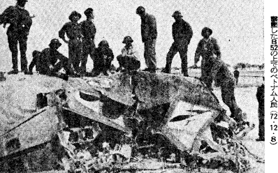
中核派の革命論を批判する

二段階戦略に転落したプロスタの中核派民族解放闘争論。二段階戦略に転落したプロスタの中核派民族解放闘争論。