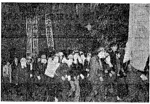
十一、十二、十三日の学生闘争

【東京十三日】値上げを実力粉砕せよ、1.13抗議闘争に結集し、闘争を繰り広げている。闘争は、値上げを実力粉砕せよ、1.13抗議闘争に結集し、闘争を繰り広げている。闘争は、値上げを実力粉砕せよ、1.13抗議闘争に結集し、闘争を繰り広げている。闘争は、値上げを実力粉砕せよ、1.13抗議闘争に結集し、闘争を繰り広げている。闘争は、値上げを実力粉砕せよ、1.13抗議闘争に結集し、闘争を繰り広げている。