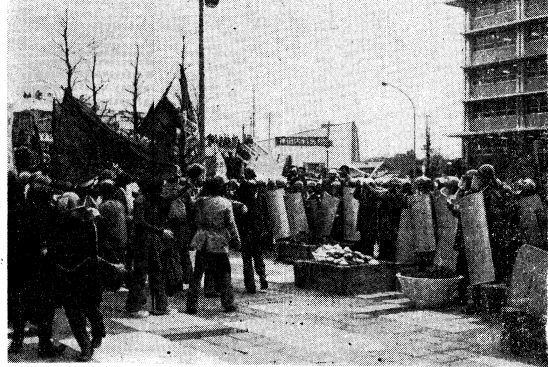
ゲモを先羽衣公園へへの入場を妨げるとする暴動隊を拘束

【東京十三日】九・一六青行隊裁判の審理は、昨日（十二日）午後九時から東京地方裁判所第三刑事部で続行された。検察側は、被告の証言に矛盾があるとして、新谷一人の証言を許さず、被告の証言を認めないとした。 被告の証言によると、被告らは、九・一六に、青行隊の旗を掲げ、三塚空港に侵入し、空港の設備を破壊し、機銃掃射を行ったと主張している。検察側は、被告の証言と、現場に残された機銃掃射の痕跡とが一致しないとして、被告の証言を認めないとした。 また、被告は、機銃掃射を行ったのは、機銃掃射隊の隊員であると主張している。検察側は、機銃掃射隊の隊員は、機銃掃射を行った後に現場から逃げ去っており、被告らは機銃掃射隊の隊員と接触しなかったと主張している。被告は、機銃掃射隊の隊員と接触したと主張している。検察側は、機銃掃射隊の隊員は、機銃掃射を行った後に現場から逃げ去っており、被告らは機銃掃射隊の隊員と接触しなかったと主張している。