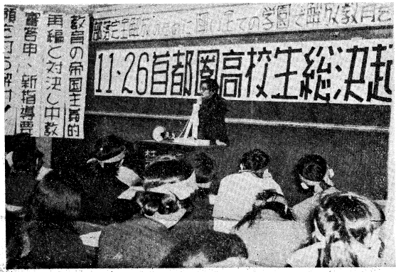
11・26首都圏高校生総決起

11月26日、首都圏で高校生総決起が行われた。この改正案は、地方自治法改正案の、大規模な改訂案として、一挙に提出された。