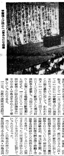
値上げ阻止の闘争

【東京十三日】諸戦線との連帯の中、値上げ阻止に更に奮進した。この奮進は、値上げ阻止同盟によって組織され、値上げ阻止同盟のメンバーによって行われた。 奮進のメンバーは、値上げ阻止同盟のメンバーであり、値上げ阻止同盟のメンバーによって行われた。奮進は、値上げ阻止同盟のメンバーによって行われた。奮進は、値上げ阻止同盟のメンバーによって行われた。