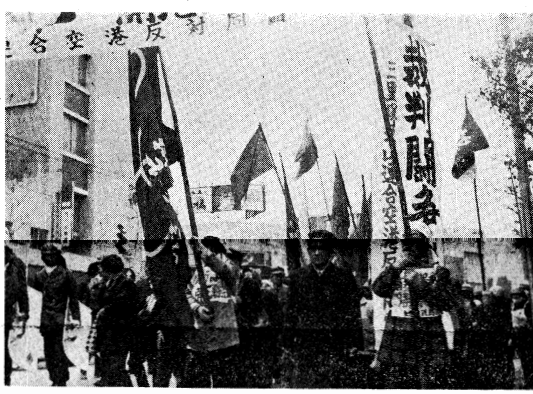
三塚空港粉砕 刑法改悪阻止

【東京十三日】三塚空港粉砕 刑法改悪阻止の審理は、昨日（十二日）午後九時から東京地方裁判所第三刑事部で続行された。検察側は、被告の証言に矛盾があるとして、新谷一人の証言を許さず、被告の証言を認めないとした。 被告の証言によると、被告らは、九・一六に、青行隊の旗を掲げ、三塚空港に侵入し、空港の設備を破壊し、機銃掃射を行ったと主張している。検察側は、被告の証言と、現場に残された機銃掃射の痕跡とが一致しないとして、被告の証言を認めないとした。