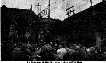
11・19芦屋射爆場解体に赴いた九州反戦部隊