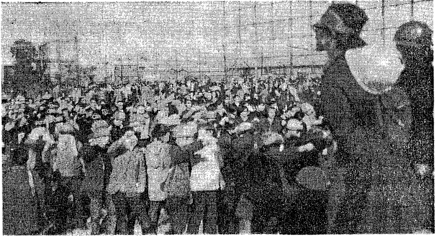
説明集会参加者に3000人の学生が決起