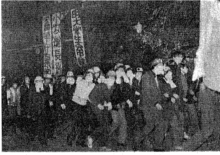
本誌同人入会費集り集り集り集り

「12月9日、京都豊林年金会館で開催された「12.9 関西政治集会」は、戦旗派の同志を中心に、各界の労働者、学生、市民の参加を得て、大成功を収めた。集会は、11時開始、11時半から12時半まで、京都豊林年金会館で開かれた。参加者は約100名に達した。集会は、戦旗派の同志を中心に、各界の労働者、学生、市民の参加を得て、大成功を収めた。集会は、11時開始、11時半から12時半まで、京都豊林年金会館で開かれた。参加者は約100名に達した。