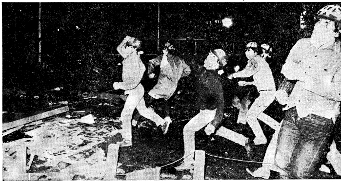
「搬出阻止、テント村死守」を掲げ、投石戦を展開する反帝戦線

「反帝戦線」は、相模原、狭山、三里塚の闘争を軸として、反帝戦線を展開し、労働者階級の団結を促すことを目指している。この戦線は、帝国主義の侵略と搾取に反対し、労働者の権利と自由を擁護するために立ち上がった。相模原の闘争は、労働者の団結と組織化の過程を示し、狭山の闘争は、環境破壊と公害問題への抗議を象徴している。三里塚の闘争は、原子力発電所の建設反対運動として、国民的規模での支持を得ている。この戦線は、労働者階級の団結と組織化を通じて、社会変革を達成することを目標としている。