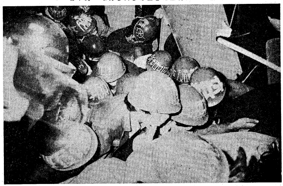
19日6時、最後まですわりこみを貫徹せんとする反帝戦線に闘いにかかる機動隊

日時 10月19日五時三十分 場所 牛込公会堂 基調報告 日向 朔 挨拶 共産主義青年同盟全国委員会 運輸部長 三里塚芝山連合空港反対同盟・沖青同