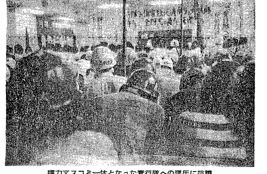
権力マスコミ一体となった青行隊への弾圧に抗議

【三河】相模原で米戦車輸送ストップ。連日、米軍機動隊と対決。この闘争は、相模原の米戦車輸送をストップし、米軍機動隊と対決するものである。この闘争は、相模原の米戦車輸送をストップし、米軍機動隊と対決するものである。この闘争は、相模原の米戦車輸送をストップし、米軍機動隊と対決するものである。