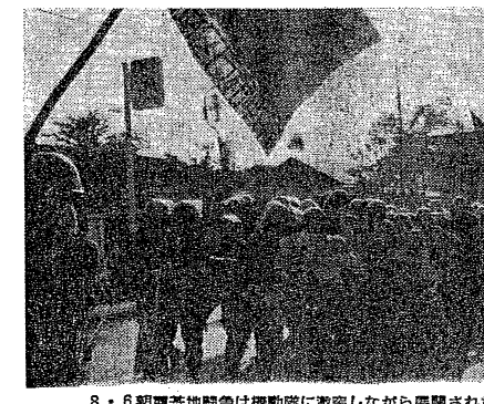
6朝霞基地闘争は機動隊に激突しながら展開された

【三河】三里塚青行隊の不当逮捕に断固たる抗議集会勝ちこる。この集会は、三里塚青行隊の不当逮捕を糾弾し、その撤廃を要求するものである。この集会は、三里塚青行隊の不当逮捕を糾弾し、その撤廃を要求するものである。この集会は、三里塚青行隊の不当逮捕を糾弾し、その撤廃を要求するものである。