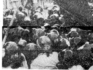
北海道反帝戦線決起の集まり

【東京27日電】北海道反帝戦線は、18日長沼ミサイル搬入阻止へ決起した。北海道反帝戦線は、18日長沼ミサイル搬入阻止へ決起した。北海道反帝戦線は、18日長沼ミサイル搬入阻止へ決起した。