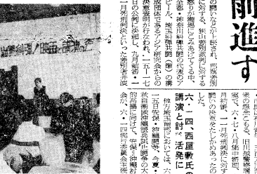
六・十七日狭山差別裁判糾弾連続闘争(狭山駅前)