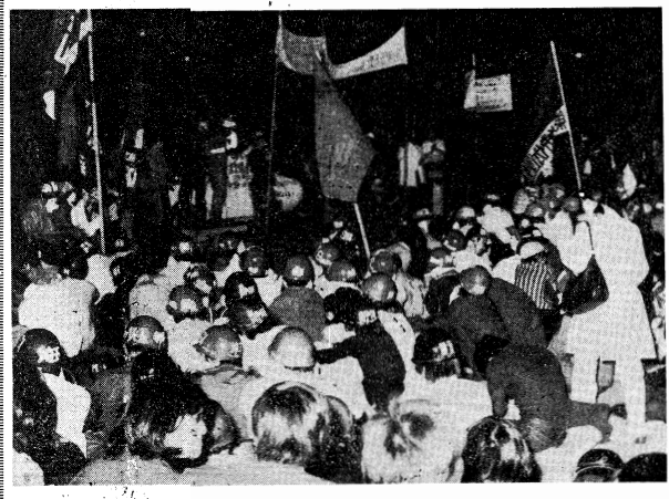
6月15日安保沖繩闘争は、代々木公園で蜂起プロ独派の下、圧倒的に闘われた

あらゆる弾圧をはねのけ 七月北熊本闘争へ準備せよ 全日本共産主義者同盟(戦旗派)は、六月十五日、安保沖繩闘争の勝利を記念して、代々木公園で蜂起プロ独派の下、圧倒的に闘われた。この闘争は、安保闘争の歴史に重要な一頁を刻み、プロ独派の勢力を大きく弱体化させた。この勝利は、我々の闘争の方向性を示し、七月北熊本闘争への準備を進めなければならない。