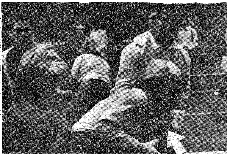
ナチス棒(矢印)をふりかざし戦士におそいかかる私服

放火罪の適用が、戦時体制下の言論弾圧の道具として悪用されている。放火罪の適用は、戦時体制下の言論弾圧の道具として悪用されている。放火罪の適用は、戦時体制下の言論弾圧の道具として悪用されている。放火罪の適用は、戦時体制下の言論弾圧の道具として悪用されている。