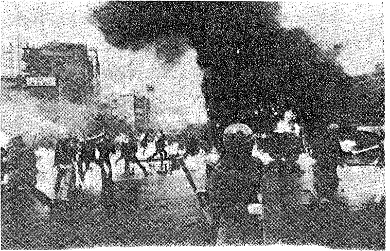
5月13日反帝戦線の遊撃戦闘は米軍の水上艦隊を痛撃した

5・15 式典粉砕に圧倒的に決起 5月15日の式典粉砕は、米軍の侵襲を阻止し、沖縄の解放を前進させた。この勝利は、沖縄の反帝戦線が、米軍の侵襲を阻止し、沖縄の解放を前進させた。この勝利は、沖縄の反帝戦線が、米軍の侵襲を阻止し、沖縄の解放を前進させた。