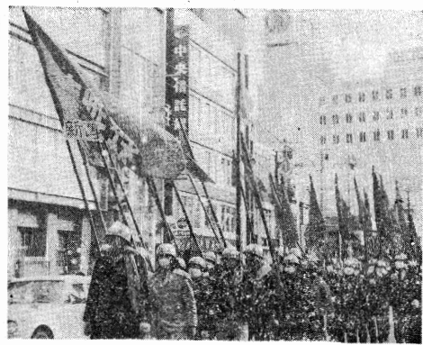
赤ヘル叛軍を全国に第14-15回公開闘争大会(16日)

全国叛軍の闘争は、1972年2月23日、東京で「全国叛軍討論集会」が開催された。この集会は、九州叛軍の闘争を支持し、全国に闘争の火を点すことを目的とした。集会には、全国各地から多くの参加者が集まり、九州叛軍の闘争の現状と今後の展望について話し合った。