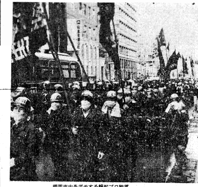
福岡市内をデモする群衆の約数

【札幌27日通信】北海道 反対同盟と連帯し長沼闘争。北見工大無期限ストに突入 16日。