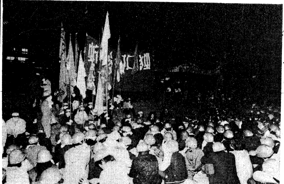
13日全国から集まった反右派闘争の先導隊300を中心に5000の先導隊の労働者学生が参加した集会の様子が写っています。