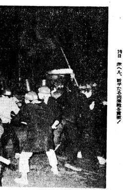
11月20日 礪川公園に決起して弾劾

【東京23日共同通信電】日本共産党の「批准阻止」闘争が、首都圏を中心に激化している。11月14日、清水谷に約三千名の共闘隊が集結し、批准阻止を叫び、強行採決を弾劾した。同日、礪川公園でも約五千名の決起があり、批准阻止の連続的激流が首都に押し寄せた。