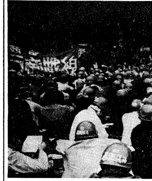
11月14日 清水谷を襲撃した革命的戦士

【東京23日共同通信電】日本共産党の「批准阻止」闘争が、首都圏を中心に激化している。11月14日、清水谷に約三千名の共闘隊が集結し、批准阻止を叫び、強行採決を弾劾した。同日、礪川公園でも約五千名の決起があり、批准阻止の連続的激流が首都に押し寄せた。