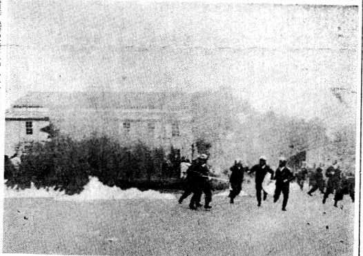
11・10九大で成龍バリストを襲撃、機銃掃射を演ずる

【東京10日電】赤ヘル部隊は、全国的に批准阻止の闘争を展開し、幌114革マル派の敵対を粉砕する一歩前進した。赤ヘル部隊は、全国的に批准阻止の闘争を展開し、幌114革マル派の敵対を粉砕する一歩前進した。