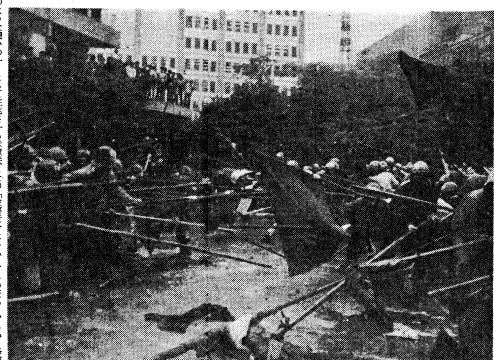
4月28日、日比谷、若が逃げ出す前の野合演