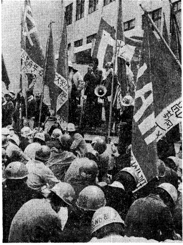
4月10、小西三村から開く叛軍闘争の先鋒行動(吉野)

【東京10日】叛軍闘争の先鋒行動として、小西三村(吉野)から開かれた第四回全国叛軍開かる。この日は、全国各地から参加した闘争者約千名が、小西三村の中心地である小西村に集結した。開会式では、叛軍闘争の意義と、今後の闘争方針が述べられた。参加者からは、各地で展開されている闘争の報告が行われ、互に激励しあう場面も見られた。この行動は、叛軍闘争の発展と、行政訴訟との結合を目的として行われたと見られる。