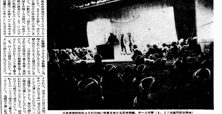
三重準備陣地より力強い叫びを受ける反帝戦線、赤へん学軍 (4.27共産同政治集会)

プロレタリアートは、権力奪取のための闘争において 組織の強化と闘争の展開。プロレタリアートは、権力奪取のための闘争において、組織の強化と闘争の展開を重視する。野合右派、赤軍派、叛旗を粉碎し、共産主義の勝利を誓う。 労働者、学生、主婦など幅広い層の市民が集結し、反帝戦線の結集を遂げる。野合右派、赤軍派、叛旗を粉碎し、共産主義の勝利を誓う。