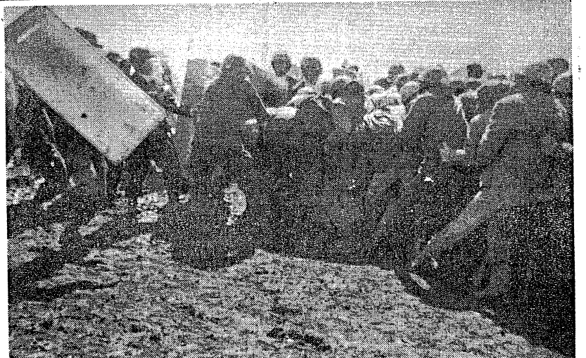
3月5日 第六地点に向け突撃する赤ヘル叛軍・反帝戦線