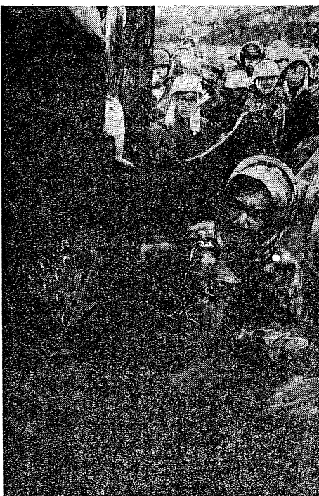
身体を鎖で柱にしはりつけ地下壕死守を闘う婦人行動隊に襲いかかる機動隊

検察と裁判所が一体化して市民の闘争を弾圧しようとしている。三月十日の第九回破防法公判は、この弾圧の典型例である。検察は、市民の健康と生活を脅かす公害行為を容認し、裁判所は、市民の正当な権利を侵害する判決を下している。このような弾圧の一体化を許すことは、市民の生命と健康を脅かすことになる。我々は、検察と裁判所の弾圧を徹底的に打ち砕き、市民の権利を守るために闘い続ける。