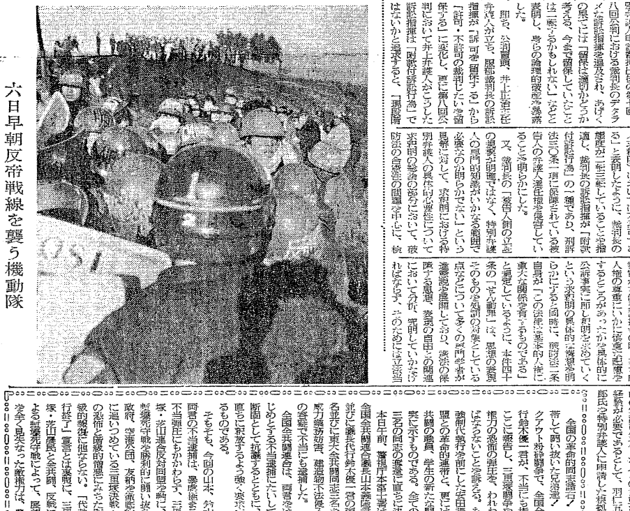
六日早朝反帝戦線を襲う機動隊

野合派の戦線崩壊は、三里塚闘争の重要な転機である。野合派は、市民の健康と生活を脅かす公害行為を容認し、市民の正当な権利を侵害する判決を下している。このような弾圧の一体化を許すことは、市民の生命と健康を脅かすことになる。我々は、野合派の戦線崩壊を歓迎し、市民の権利を守るために闘い続ける。