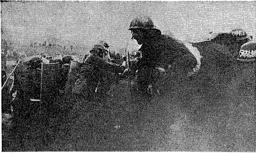
3月3日 雨と泥の中、機動隊と肉弾戦を繰返す反帝戦線

全ての労働者、学生、農民の皆さん！徹底抗戦の構えをもって激闘に闘われている三里塚闘争は、今やますます権力と非階級的闘いと突き進み、全人民的政治闘争として展開されんとしている。われわれ赤ヘル反帝戦線は、三里塚一帯の地に於いても最先端に立ち、戦線的な闘いを終始一貫闘っている事を報告しておきたい。3日から6日に至る激闘は、まさしくわれわれ反帝戦線のみが前衛隊を任ずる部分として組織的に奮闘し、戦線的、革命的に三里塚一帯山反対同盟と連帯し、闘い抜いていったといえることをまずもって確認しなくてはならない。(なお、三里塚闘争報告に関しては、前号、前々号にも掲載されている。)