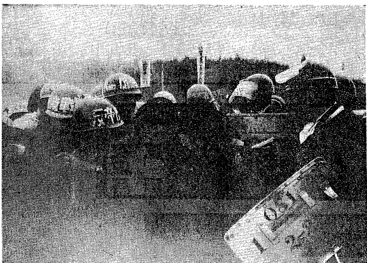
第六地点での機動隊との激突(三月二日)