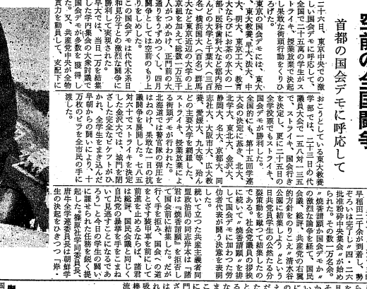
国会正門前で演説する同盟幹部政治委員

空前の全国闘争 二十六日、東京中央のデモ、おどろかしている。安保反対の闘争は、この日、全国的に展開された。安保反対の闘争は、この日、全国的に展開された。安保反対の闘争は、この日、全国的に展開された。