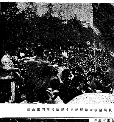
国会構内大抗議集會

五・一三ゼネスト 警官の妨害はねのけ 国会構内大抗議集會を 安保反対の闘争は、この日、全国的に展開された。安保反対の闘争は、この日、全国的に展開された。安保反対の闘争は、この日、全国的に展開された。