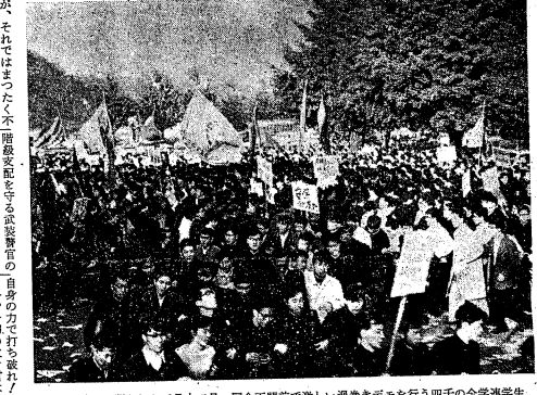
中央公園の開かれた五月十三日、国会正門前で激しい過激なデモを行う四万の全学連学生

決戦の時来た 全国の学生、労働者、農民、市民、各界の同志、今こそ立ち起し、五二〇の決戦を挑めよ。岸内閣の暴走を止め、国会の会期延長を絶対阻止せよ。批准の粉砕まで坐り込み、十重廿重に国会を包囲せよ。会期延長絶対阻止岸を打倒せよ。共産主義者同盟の主張は、労働者の権利を守るため、民主主義の発展のため、社会正義の实现のためである。五二〇の決戦は、単なる学生運動ではなく、国民的運動として展開されるべきである。労働者は、この運動に積極的に参加し、社会正義の实现に貢献せよ。共産主義者同盟は、この運動をリードし、勝利を導くことを誓う。