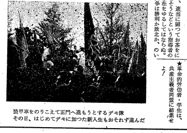
装甲車をのりこえて正門へ進むとするデモ隊 その日、はじめデモに加った新入生もおそれず進んだ

安保反対の闘争は、この日、全国的に展開された。安保反対の闘争は、この日、全国的に展開された。安保反対の闘争は、この日、全国的に展開された。