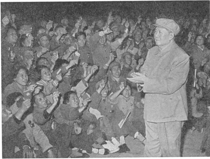
中華人民共和国成立十九周年祝賀会の夜 労働者階級の代表のあいだに姿をみせた毛主席