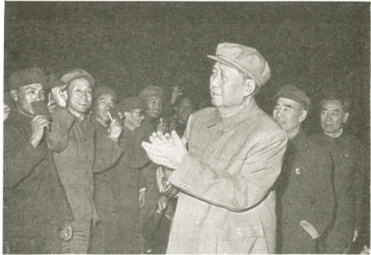
各地から来た革命的戦士と親しく会見する 毛主席とその親密な戦友林彪同志および周恩来同志