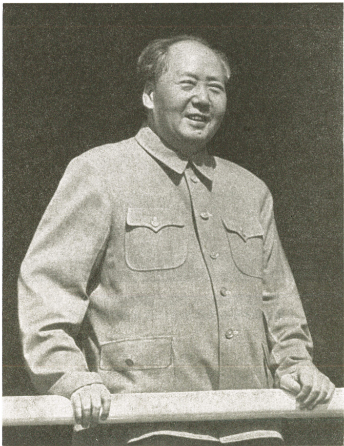
天安門城楼上行進の隊列を観閲する毛主席