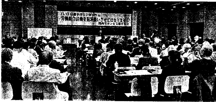
関生京都事件、25年2月26日の判決を前にシンポジウム(11月12日 京都市)

また乾式貯蔵された燃料はそのまま原発構内におかれ、事実上永久貯蔵となる。使用済み燃料を増やす原発運転は、もうやめよ。第7次エネルギー基本計画は、いま策定中であるが、原発の増設、関西電力本店前に総集場し新設を打ち出し、原発