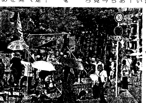
2023年7月、炎天下380人が関電本店を包囲(大阪市)

2024年の反原発闘争を集約し、25年を展望するたたいであり、関西電力本店包囲大集会は、原発依存社会への暴走を止めよう! 「12・8とめよう!」 原発依存社会への暴走 認し、再度原子炉を起す。二度と女川をうごかす。動かす。これは、今までの原発再稼働時に聞かれた大きな声、大きな行動で「原発反対」を社会の隅々までつづら