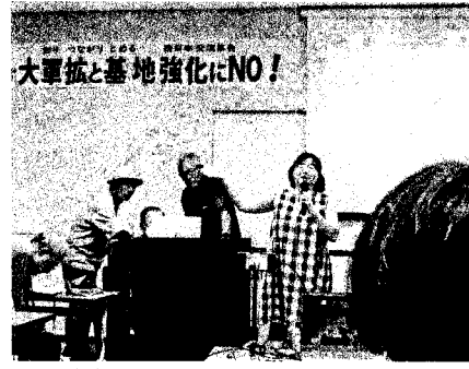
西日本中心に100人が呉に集った (9月21日)

9・23老朽原発うごかすなー! 高浜全国集会、高浜町文化会館の本集会に先立ち、高浜原発ゲート前で、関電にたいする申し入れと抗議闘争が取り組まれた。 高浜町文化会館の本集会では、珠洲市住民で志賀原発を廃炉に!