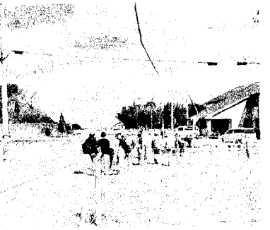
1963年の面影が残る「出会い地点」とされるX字型交差点。先方左の森が「山学校」(9月23日)

今、なぜ再審法改正か？ 具体的事件から考える狭山再審を求める市民の会・こころへ2024年度総会(記念講演) とき: 10月19日(土) 午後3時〜3時半 総会 午後3時45分〜5時45分 記念講演 ところ: 兵庫区文化センター 講義室 主催: 狭山再審を求める市民の会・こころへ 狭山現地調査報告会 とき: 10月21日(月) 午後7時から ところ: 尼崎 小田北生涯学習プラザ (JR尼崎駅北東4分) 主催: 狭山事件の再審を求める尼崎市民の会 18時半からJR尼崎駅北で国際反戦デー尼崎集会があります