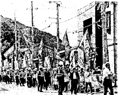
町内デモで地元住民と交流 (9月23日)

9月23日、高浜原発うごかすなー! 高浜全国集会、高浜町文化会館の本集会に先立ち、高浜原発ゲート前で、関電にたいする申し入れと抗議闘争が取り組まれた。 高浜町文化会館の本集会では、珠洲市住民で志賀原発を廃炉に!