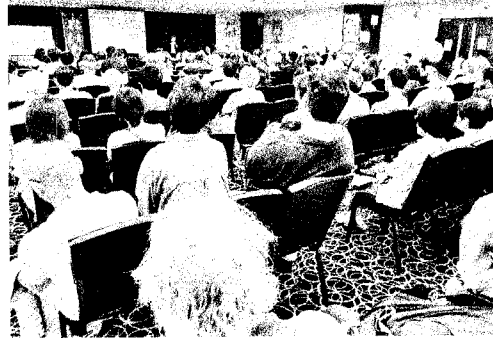
会場一杯の9・19総決起集会(大阪市内)

「緊急 衆議院解散 505万円↓2020 どのなるか?」山本太郎(374万円)・企業 大石あきこ講演会が9月19日、大阪市内 大石あきこ講演会が9月19日、大阪市内 大石あきこ講演会が9月19日、大阪市内