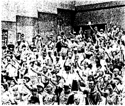
老朽原発うごかすなー! (高浜町文化会館)