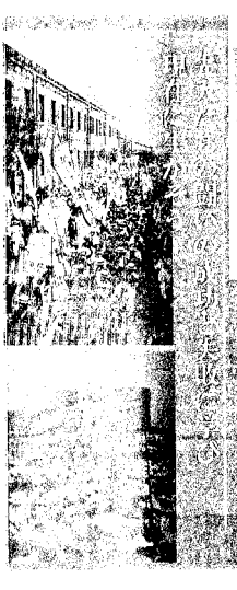
○工友の闘争 闘争の場から闘争の場へ