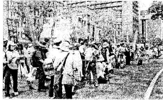
京都市役所前に200人が集った(6月8日)