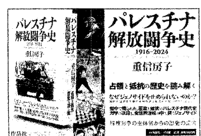
【未来】編集部でも扱います。