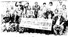
参加者全員で記念写真

名古屋高裁判決は、原告の声を聴くふりをした大阪高裁と、原告が全面勝訴した名古屋高裁の2つの上