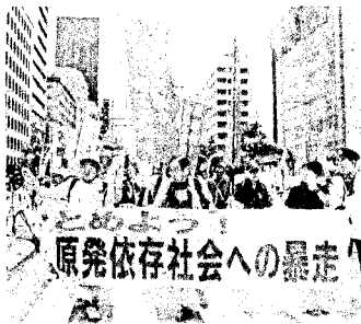
先頭をいく福井、滋賀、全国の人々