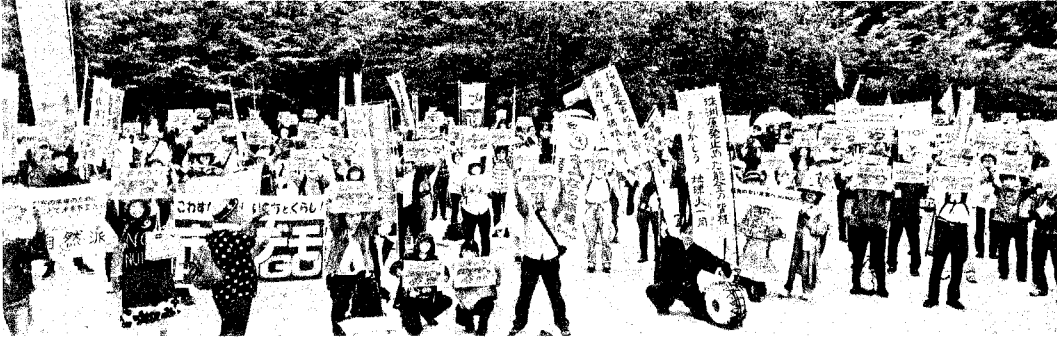
小雨まじりの天候のなか集まった1400人。力強くポテッカードをかかげる(6月9日 大阪市)

革命的共産主義者同盟再建協議会 http://miraikakuyodo.jp/