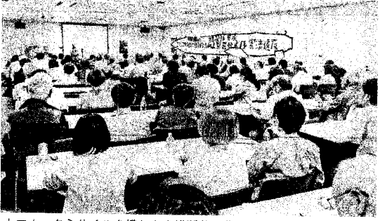
トマホークミサイルを模した大横断幕を作り100人を超す市民が参加(6月2日 奈良)

市民宣言を採択 最後に「核汚染水S TOP!世界市民宣 言書」がよみあげられ 全体の拍手で採択され