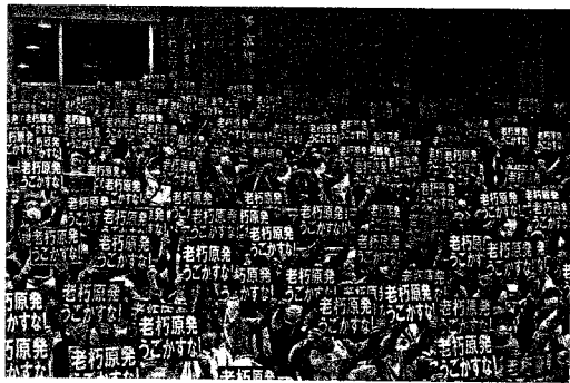
会場一杯の参加者がメッセージボードをかかげる(3月31日)

この3月、関電の原 発運転差し止め仮処分 (3件)について、裁 判所の判断が示され た。住民側の主張は、 全て退けられた。ひと つは、老朽原発(40年 超原発)美浜3号機の 運転差し止め仮処分 について、3月15日に大 阪高裁が即時抗告して いた件(申し立て7 人)が棄却、3月29日 に福井地裁の件(申し 立て19人)が却下さ れた。