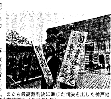
またも最高裁判決に連じた判決を出した神戸地方裁判所（3月21日）

兵庫県内へ避難した総勢1200人余が台流相当性（現在も続く放射線汚染と内部ひよく）に計約7億円を求め、駅での街宣行動に始まった損害賠償請求訴訟り、傍聴、法廷内外で生活を守られた損害の完全補償、を主な争点の判決が3月21日、神戸、報告集会を闘った。 ひようご訴訟の争点と判断 ひようご訴訟は、「子どもたちの未来・被災者の権利」をめぐり、裁判所が判断するべきものではないと、国への賠償請求は認められず、最高裁判決後も実質審理が続き、最高裁判決も合めた責任を否定した。