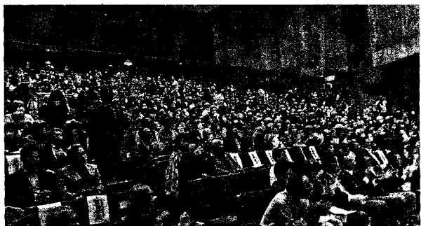
保革をこえた人々が新基地反対で広い会場をうめつくした(3月20日 沖縄県うるま市)

・24年3月11日、米海軍ミサイル駆逐艦の石垣港への寄港に対し、全港湾沖繩地方本部は「職場の港湾施設を戦争や軍事目的に使わせない、港湾労働者の安全が保証できない」とストに突入した。そこで早期未明に公道を使い自衛隊車両12台やトレーラー15台で陸上自衛隊連分屯地に運び込んだ。