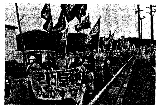
美浜町を行進する長蛇のデモ隊(3月31日)

また、井戸さんは 「能登半島地震の教訓 として、現在において も地震のことはよくわ かっている。いつか どこかでそのような事 故がおきるのか、まっ たく想定できない」と を強調した。能登半 島地震で、2つの事実 がある。2件の福井地裁 決定が即時抗告をおこ さない、高裁で闘って いくと明らかにした。