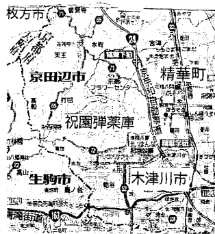
京阪奈丘陵に日本一の弾薬庫

1月21日、「祝園自衛隊弾薬庫」が地元京都府精華町でひらかれ関西一円から70人が集まった。地元有志がよびかけたもの。 見学会に先立ち、地元有志がパワポイントを使って、祝園自衛隊弾薬庫基地について説明・紹介をした。 2022年12月、岸田政権が「安保3文書」を改定した。これ以降、岸田政権は「戦争をする体制」に向けて突き進んでおり、自衛隊基地などが全国で増強されている。 陸上自衛隊祝園分屯地は、京都府の精華町と京田辺市にまたがる丘陵地帯のなかに、住民に隠れるようにして存在する本州最大の弾薬庫である。 岸田政権がめざす敵基地攻撃能力保有のため、新たに長射程ミサイルの大型弾薬庫がここに造られる計画が浮上している。しかも、陸上自衛隊だけではなく、海上自衛隊の弾薬保管もできるようにする方針だ。