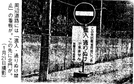
前方、林の奥に広がる470ヘクタールの敷地を持つ祝園弾薬庫（1月21日撮影） 周辺道路には「進入、通りぬけ禁止」の看板が。この先に北門が。（1月21日撮影）

分屯地の南側には、約1時間のコースだ。約1時間のコースだ。 分屯地の南側には、約1時間のコースだ。約1時間のコースだ。 分屯地の南側には、約1時間のコースだ。約1時間のコースだ。 分屯地の南側には、約1時間のコースだ。約1時間のコースだ。 分屯地の南側には、約1時間のコースだ。約1時間のコースだ。