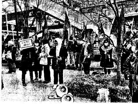
大阪駅前ではアピールするパレスチナ人 (1月13日)

1月13日JR大阪駅南口バスターミナル広場で「STOP Genocide スタンディングアピール行動」がおこなわれ、200人が広場を埋め尽くした。主催は関西ガザ緊急アクションで、昨年10月27日から始まり、毎月おこなわれてきた行動の第4波だ。この日の行動はイギリスの「パレスチナ連帯キャンペーン」ス トップ戦争連合「英人以上の市民が殺さる」という市民の苦しみ。ガザの人口230万人の10%が殺されたことになる。日本だと100万人以上を殺されるという大惨劇だ。その7割が子どもや女性。世界は黙って見ているのか。日本人は今ひとつ。毎日千人近くの一一般市民が殺されている現実を黙って見ているわけにはいかない。能登半島地震でもガレキの下に埋まっている人は100人以上。ガザでは万人近い人たちが埋まっている。日本政府の米国追従の政策をやめさせ、国民を守る政治に変えていかなければいけない。南アフリカが国際司法裁判所にイスラエルのジェノサイドを告発している。日本政府のジェノサイドへのあいまいな態度を、市民の力で変えていきたい。土曜日の夕方、通行人の多いJR大阪駅南口。途中から参加者がどんどん増え、パレスチナ国旗が何十本も掲げられ、通行人は普段はスタンディングやアピール行動にあまり関心を示さないのだが、この日は 「ガザでは2万3千人を許してはならない。ガザに對し、攻撃を止め、封鎖を解除し、水や食料を供給することを求める。戦争を中絶に拡大することを許してはならない。」 ・男性の発言 「ガザでは2万3千人を許してはならない。ガザに對し、攻撃を止め、封鎖を解除し、水や食料を供給することを求める。戦争を中絶に拡大することを許してはならない。」 「ガザでは2万3千人を許してはならない。ガザに對し、攻撃を止め、封鎖を解除し、水や食料を供給することを求める。戦争を中絶に拡大することを許してはならない。」