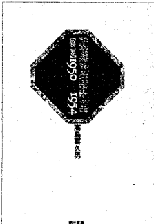
高島喜久男著 『戦後労働運動史』 第二巻

100万人以上。日教組、自治労、全職同盟(現・J・I・センセン)など150万人が職場大会、国労、全通、全電通、都市交などが超動拒否。以上合わせて335万人が参加。 第3波第1段(6月7日)は、全自動車3万、電産12万(電源スト38000人を含む)の24時間スト、全鉱の一部(7千人)、その他の制限ストも含めスト参加者180万人。 第3波第2段(6月12日)は、スト参加者80万人。統一行動参加者30万人。 以上ザッと合算して延べ約600万人の労働者が破防法反対のストライキに参加し、何らかのかたちで実力行使に決起した労働者を含めると延べ1千万人に達した。 労働ストは全国各地で展開され、地評の強化につながった。さらに地評が地区労働者のオルグに努めたことも忘れてはならない。 1952年7月4日、破防法は日本自由党と緑風会の賛成で可決成立した。保守第2