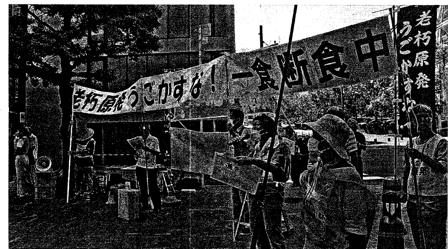
一食断食中の横断幕の前で関電に向けシュプレヒコール (9月1日 大阪市)

6時間の「一食断食」を貫徹 15時30分から16時まで集約集会がおこなわれた。こうして6時間から12月3日の1万人集会につき進もう。 行動は予定どおり貫徹された。この力をバネに、10月22日の「使用済み核燃料の行き場はないぞ! 全国集会」から12月3日の1万人集会につき進もう。