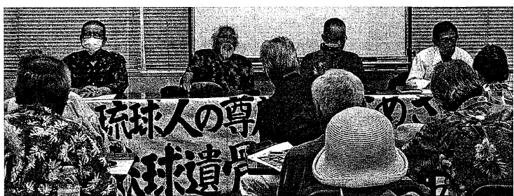
原告団が力強く報告 (8月23日 大阪市内)

24日 辺野古新基地建設で、沖縄防衛局の設計変更申請を県が不承認とした処分を巡り、県が国の関与を取り消しを求めた2件の訴訟で、最高裁第1小法廷(岡正鼎裁判長)は、国交相の採決に関する訴えを受理しないと決定した。是正指示に関する訴訟は受理し、9月4日に上告審判決を言い渡すと決めた。是正指示の訴訟では、福岡高裁那覇支部判決を撤回する必要があると、県が敗訴する可能性が