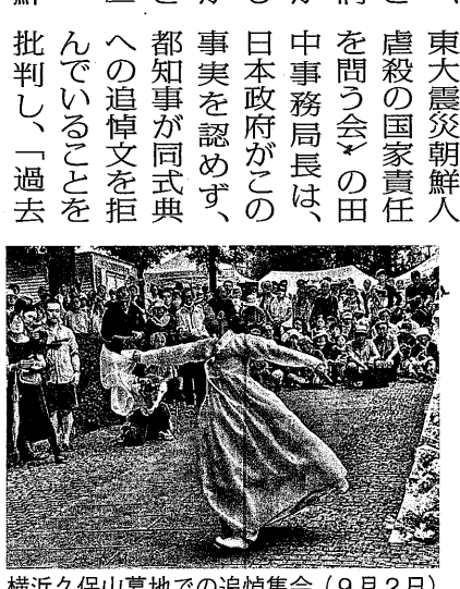
横浜久保山墓地での追悼集会 (9月2日)

「まだ」殺され「いいね」がつけれ、それがドンドン拡散されている。ヘイト解消法ができて7年、しかし当時より状況が厳しくなっていると。だから、事実を認めず、都知事が同式典への追悼文を拒んでいることを批判し、「過去を直視し、責任を問い続けたい」と訴えていた。