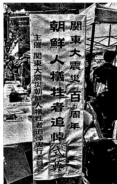
関東大震災百周年 朝鮮人犠牲者追悼式典 (9月1日 東京都墨田区横網町公園/関連記事2面)