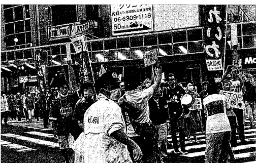
反増税かかげ、大阪の下町十三をデモするれいわ新選組 (6月30日)

大阪府議会が6月9日、議員定数を81から70に削減する大阪府条例改正案が賛成多数で可決された。これは「維新の新政」を表明した。