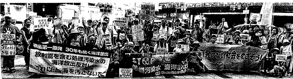
7月17日、ヨドバシ前で抗議 (大阪市内)

っている。日本政府は「次世代にリスクを残さないように、なるべく早く処分を終える」と言っている。次世代のことを真剣に考えるのであれば、いままず原発は停止して、これ以上、放射性廃棄物を増やさないことではないのだろうか。