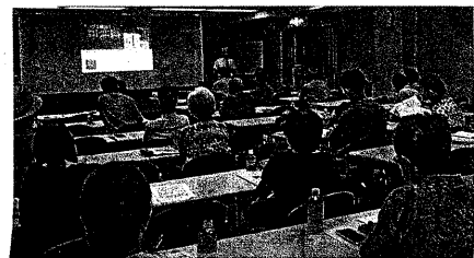
マイナへの関心の高い学習会 (7月22日、大阪市)

マイナンバー制度は、マイナンバーと被保険者番号の紐づけが間違っていることが原因。マイナカードを持っていない人も、間違っている紐づけ