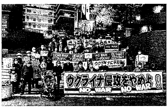
各地でウクライナ反戦の行動

中国とロシアを、資本主義・帝国主義に一般化することは間違っている。現象的類似に引きずられ、ロシアのウクライナ侵略の次は中国の台湾、沖繩(日本)侵略が迫っているという右翼のデマに途を拓くことになる。また両者におけるスターリン主義の影響を無視することも過大視することもある。ロシアは「スターリン主義」独裁制」と客観主義的に規定して、そこに生きる労働者人民の苦悶を無視することになるからである。 現在のロシアの体制は、「旧ソ連時代のスターリン主義の残滓に広範に取り巻かれた特殊な資本主義」と規定できる。賃労働・資本