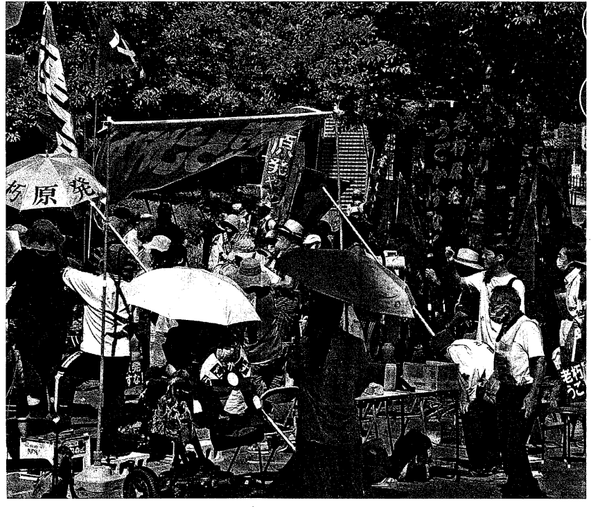
炎天下 380人が関電本店を包囲 (7月23日 大阪市内)

7月末に入り岸田政権の支持率が急落、毎日新聞では30%を切った。そのうえで自民党の支持率も下落。両者は併せて50%を切ると倒閣情勢と言われている。マスコミは「マイナンバートラブル」を原因とするが、それではない。何より昨年度10月から続く物価高が止まらない。食料品・電気料金など2割以上の上昇が実感。猛 7月末に入り岸田政権の支持率が急落、毎日新聞では30%を切った。そのうえで自民党の支持率も下落。両者は併せて50%を切ると倒閣情勢と言われている。マスコミは「マイナンバートラブル」を原因とするが、それではない。何より昨年度10月から続く物価高が止まらない。食料品・電気料金など2割以上の上昇が実感。猛