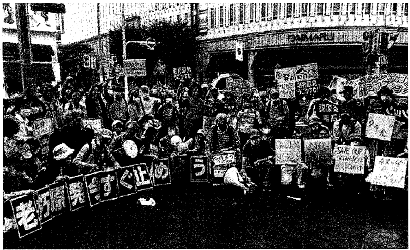
神戸集会・パレードののち、元町・大丸前で意気示す(7月9日、詳報次号)

アしたということ、7・28再稼働を公表したのである。規制基準さえ適合しない状況のなかで、最古の老朽原発高浜1号機の再稼働を許してはならない。 使用済燃料搬出の詭弁 関電は、老朽原発再稼働への地元同意を得るために、「23年末までに、県外に使用済み燃料の搬出先候補地を示す。もし見つけれなかった場合、たとえ稼働中であっても、老朽原発は停止する」と報告した。20年代後半にフランスに搬出するといふもので、その量も合計2百トンでしかない。関電が約束した2千トンの1割に過ぎない。関電のこのようなベテ、詭弁を許してはならない。福井県民は、人を愚弄するにほごがあるとして一斉に猛反発している。 このような、ベテ、詭弁を弄すのは、福井県が使用済み核燃料を県外に搬出することを一貫して求めており、原発内のプールに保管されている使用済み核燃料が、もはや満杯になり、この意味でも原発の運転ができません。この間に、関電はいつまでたっても、このように超危険な原発をうごかすことは、もはや犯罪であり、奪おうとすることだ。 7・23関電本店前に集まり、「老朽原発再稼働阻止」の怒りの声を、関電と岸田政権にたたきつけよう。