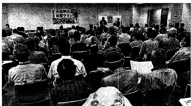
コロナ禍のりこえ全国から140人が集まった(5月27日、神戸市内)

大逆事件100年を神戸に集まり開催された。受け入れたのは5年前から神戸の犠牲者集会サミットの第5回を明らかにする活動を開始した。大逆事件を明らかにする兵庫の会。