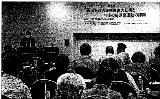
関西ブロックが集会 (7月2日 高槻市内)

7月2日、(反原発自治体議員・市民連合)が記念講演「岸田閣内閣の原発推進大転換」と講演会が、大阪府高槻市内でおこなわれ、オンラインを含めて75人が参加した。講演会では、①山