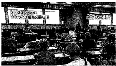
熱心な討論のシンポジウム(6月25日)