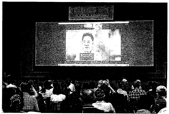
沖繩現地と連帯し、大阪で集会(6月23日)

1947年9月22日沖繩に関する天皇メッセージ「アメリカが25年ないし50年あるいはそれ以上沖繩