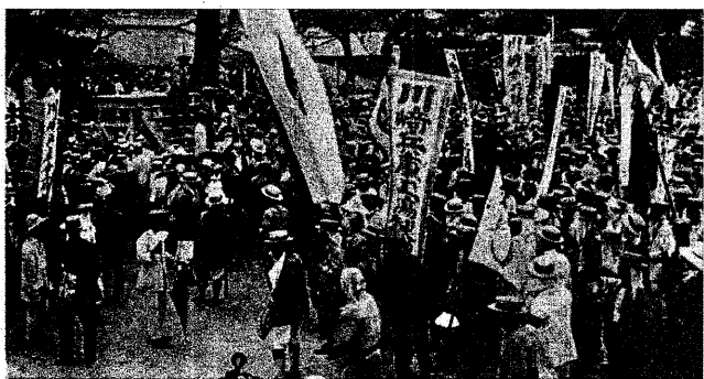
川崎兵庫工場の大きなのぼりが見える

前号に述べた勢を固持し続けた。1921年7月10日のデモ行進の成功と、全市ゼネスト前後のよきな状況を生み出したことによって、争議団幹部は自信を深めた。 しかし、川崎・三菱両資本とも、大阪の一連の争議で資本の側が譲歩を強いられた轍を踏むまいと、一切の妥協を排して対決する姿勢を閉じた。