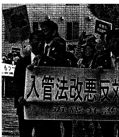
入管法改悪反対で緊急行動 (5月9日、大阪市内)

「戦争」を「有事」と言い換え、「敵基地攻撃能力」を「反撃能力」と言い換えて「国民に考えられなくしてきた政策の結果だ」と語った。第二次世界大戦のとき日本においてはバリケツリレーと竹やりの