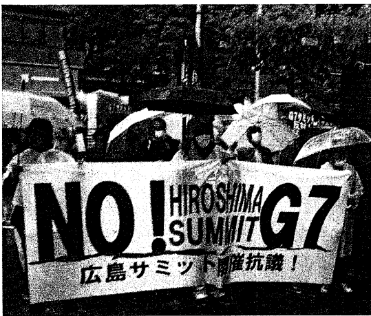
弾劾するデモ行進 (5月7日、大阪市内)

「戦争」を「有事」と言い換え、「敵基地攻撃能力」を「反撃能力」と言い換えて「国民に考えられなくしてきた政策の結果だ」と語った。第二次世界大戦のとき日本においてはバリケツリレーと竹やりの