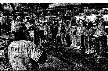
最終日はJR立花駅で演説(4月8日)

尼崎選挙区は1人のゲーム。共産も前回2党、社民党、れいわ新選組を除いて7議席を人立候補を今回1に選出の支持も受け、さ自民2、維新2、公明2、維新は現職と昨年2、共産、緑の8人が11月市長選敗退候補が争う究極の椅子取り出馬。