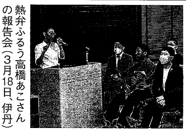
伊丹市でフオーラム伊丹の演説会。藤原市政の横暴に市民の怒りがたまっていく。維新と変わらぬ幼派・フオーラム伊丹が、

伊丹市では5期続く藤原市政の横暴に市民の怒りがたまっていく。維新と変わらぬ幼派・フオーラム伊丹が、