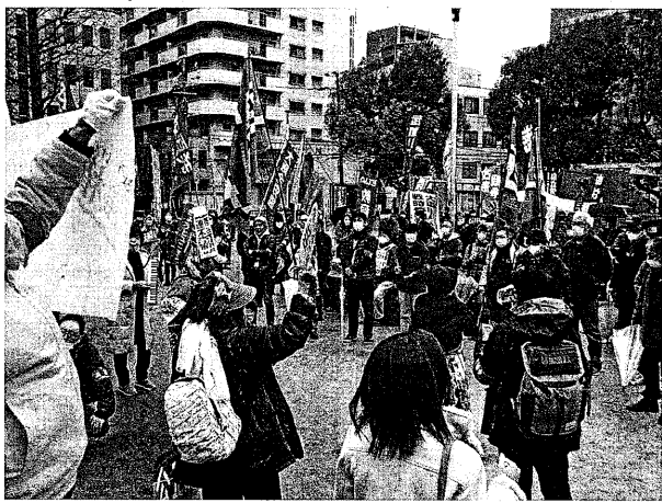
大津・和歌山判決を前に、関生弾圧反対でこぶしをあげる (2月18日 大阪市内)

3月2日の「関生弾圧 週間にあたる2月18日、労働組合つづしのアクションが大阪、東京など全国6カ所(さくらに別の日にも2カ所)で開かれた。