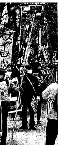
老朽原発ごかすな！デモ行進 (2021年12月5日、大阪市内)

11月2日、原子力規制委員会は原則40年という原発の運転期間のルールに代わり、運転開始から30年を起点にして、10年を超えない期間ごとに建物や原子炉の劣化具合を審査する案を示した。これは、60年超の原発運転を可能とすることだ。