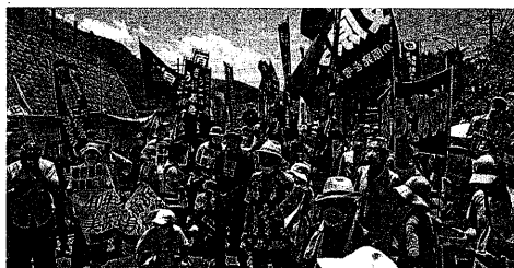
美浜3号機再稼働に反対する人々 (7月24日、福井県美浜町)

が決められた。今回の60年超運転の策動は、これまでの原子力規制を根幹から変えて、しかも原子炉の安全性ではなく、電力の安定供給を理由に延長できるのだ。それも、経産省の手で。絶対に許してはならない。美浜3号機を再稼働する「明日(30日)美浜3号機を再稼働する」と突然発表した。本来ならば、40年超運転への挑戦ということに對し、大々的に宣伝し、謳歌するのが当然であるにもかかわらず、それもできない。向けて総決起しよう。12・4闘争を全国集会へ