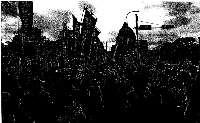
安倍の国葬に反対し国会を包囲 (9月27日)

●発行所 前進社関西支社 〒532-0002 大阪市淀川区東三国6-23-16 (振替 00970-9-151298) ●発行人 佐藤一 ●第1・3木曜日発行 ●200円(本体182円) ●定期購読 購読料(送料別) 1月 400円(送料188円) 半年 2,400円(送料1,128円) 1年 4,800円(送料2,256円) 革命的共産主義者同盟再建協議会 http://miraikakukyodo.jp/