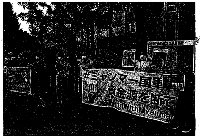
死刑執行に抗議 (8月1日 首相官邸前)