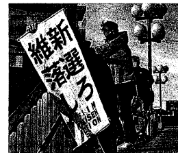
維新落選しろ(21年4月、宝塚)