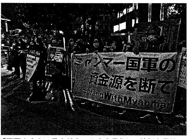
「国軍を支える最大勢力は日本企業」と、首相官邸前で行動 (2月1日)

2月1日、ミャンマー国軍によるクーデターからちょうど1年が経過した。東京では2月1日の昼間にシンポジウムが開かれ、夜には「#ミャンマー国軍の資金源を断て」クレーターから1年ミャンマー0201ツイッターX官邸前アクションが取り組まれた。官邸前には60人が集まりアピールに耳を傾けた。「本当はやり