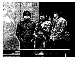
実名を出し訴える3人のミャンマー

現状を知ってもらった。めい3本のビデオ上映がおこなわれた。いずれもユーチューブでもみることができ