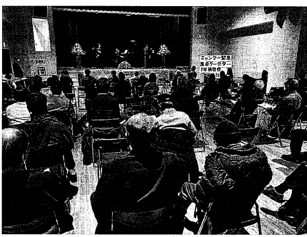
犠牲者数のバラをあしらった横断幕をかかげ追悼の集会とアピールがなされた (2月1日、尼崎市)

2月1日、兵庫県尼崎 急集会が開催された。 崎市内でミャンマー緊 最初にミャンマーの