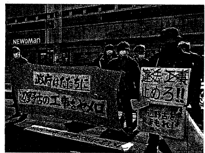
2.5 辺野古 新宿スタンディング

1月29日(土) 13時 基地の集中の問題性、新宿アルタ前に集合。米兵によるコロナ持ち込みへの岸田の無為無策・技術的に基地建設が不可能などを道行く人々へ訴えた。14時か新宿デモ」が取り組まれた。主催は「辺野古古埋め立て不承認支持」政府は直ちに工事の中止を訴え、途中工