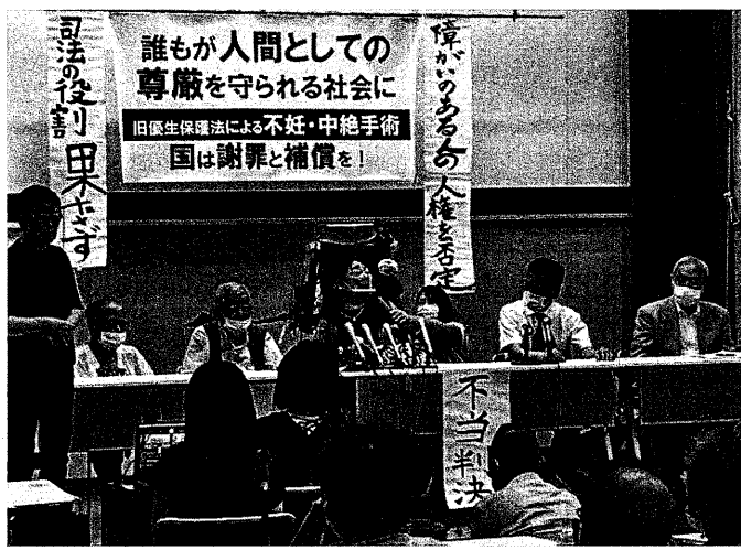
8月3日の判決に怒りの記者会見の原告たち(神戸市内)