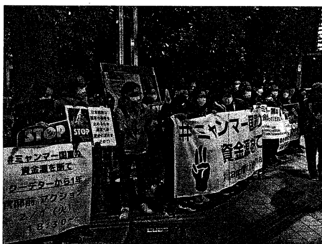
ミャンマー国軍を支援する日本政府を追及 (2月1日、東京)

湯川裕司委員長が講演 第1部の最後に、連 帯労組関生支部の委員 長に昨年秋に就任した (2面へ続く) 感染拡大は保育所・ 高齢者施設という社会 的弱者に集中する。職 員が感染すると他の職 員に負担となるため、 無症状の陽性者は感染 拡大の可能性があつて も出勤する。こうし て子どもが感染が広ま り、子どもから家族(父 母・祖父母)に広が り、高齢者施設のクラ スターで感染者が激増 し、高齢者の重症化と 死亡がどんどん増える 悪循環だ。これに対し 岸田政権・厚労省は全 く無責任で、各自自治 体保健所も手上げ状態 が2月10日の現状だ。 政府と東京・大阪な の自治体との連携も できず、小池や吉村ら ばかりだった。その中 には「感染が終息 するであろう」3月に 入ってから」と吐き捨 てるような会話がなさ れている。 感染拡大は保育所・ 高齢者施設という社会 的弱者に集中する。職 員が感染すると他の職 員に負担となるため、 無症状の陽性者は感染 拡大の可能性があつて も出勤する。こうし て子どもが感染が広ま り、子どもから家族(父 母・祖父母)に広が り、高齢者施設のクラ スターで感染者が激増 し、高齢者の重症化と 死亡がどんどん増える 悪循環だ。これに対し 岸田政権・厚労省は全 く無責任で、各自自治 体保健所も手上げ状態 が2月10日の現状だ。 政府と東京・大阪な の自治体との連携も できず、小池や吉村ら ばかりだった。その中