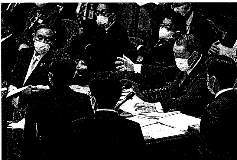
衆院予算委員会で与野党の理事に詰め寄られる金田勝平委員長(右)。左端は菅首相(1月26日)

「GOTTOラベル」けた経済対策。コロナの延長費1.1兆円など 拡大防止策は全体の2割を盛り込んだ今年度第3次補正予算が、1月28日 参院本会議で可決成立した。補正予算の総額のうち「コロナ」が6割強が「コロナ後」の方向性。観光庁発表の「GOTTOラベル」の執行額は484.2億円にとどまるとおり、1.1兆円を年度内に使い切ることは不可能だ。